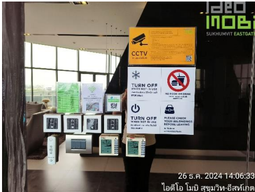
ภาพที่ 25 ป้ายรณรงค์ประหยัดพลังงาน