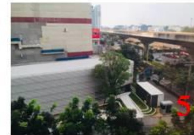
รูปที่ 2.1-6 สภาพพื้นที่โครงการในปัจจุบันและสภาพแวดล้อมแนวเขตติดต่อพื้นที่โครงการ