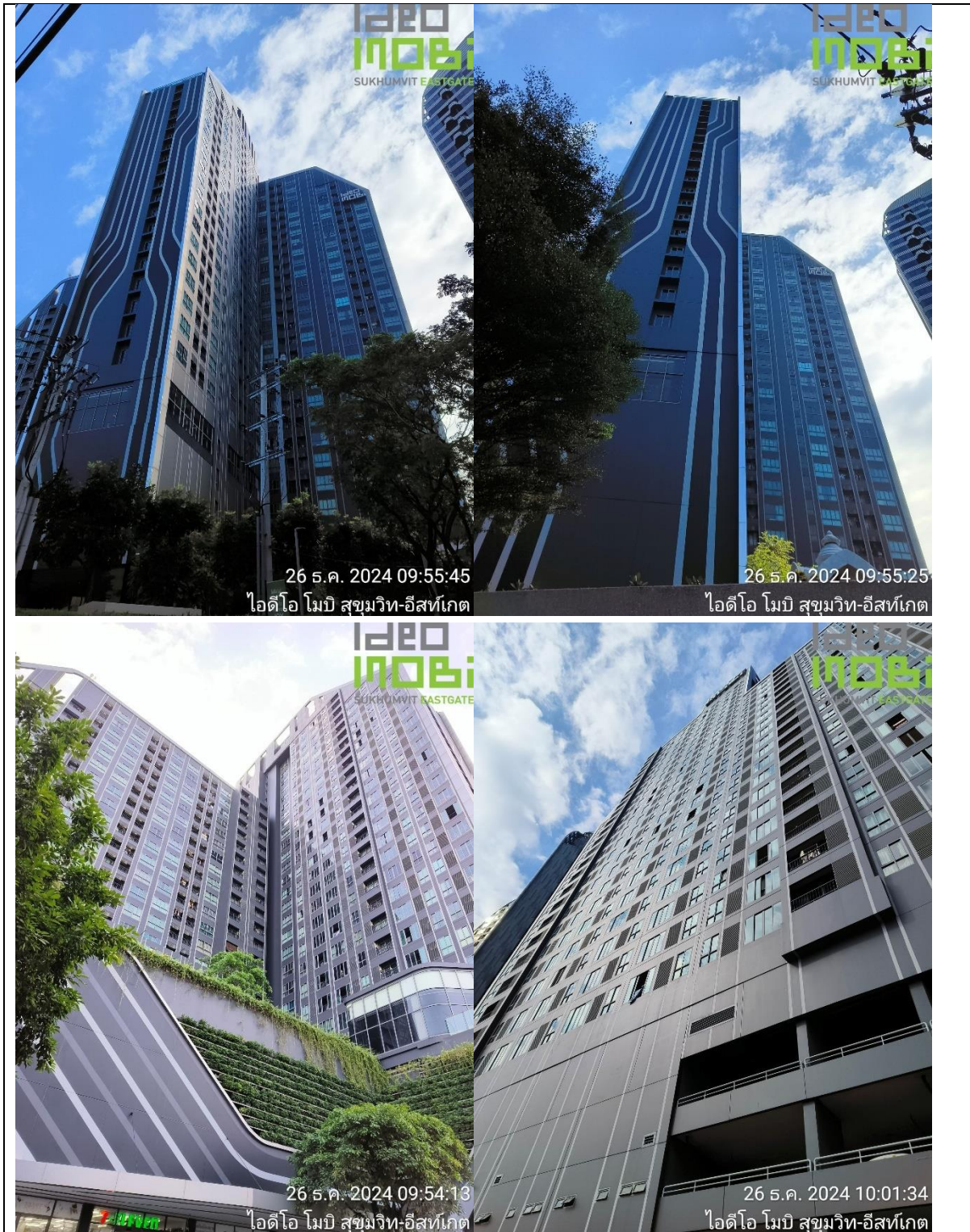
ภาพที่ 1.6-1 สถานภาพการดำเนินโครงการในปัจจุบัน

สถานภาพของโครงการในปัจจุบัน พบว่า โครงการอยู่ในช่วงเปิดดำเนินโครงการ แสดงสถานภาพการดำเนินโครงการในปัจจุบันได้ดังภาพที่ 1.6-1