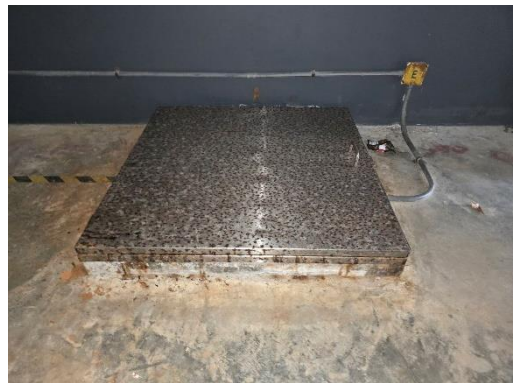
ภาพที่ 27 ถังสำรองน้ำชั้นดาดฟ้า/ชั้นใต้ดิน