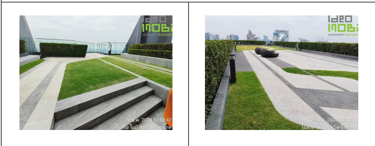
ภาพที่ 12 พื้นที่สีเขียวของโครงการ