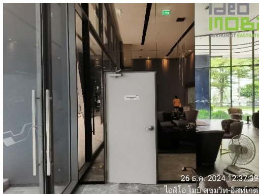
ภาพที่ 41 ประตูบันไดหนีไฟ ชั้น ST 3