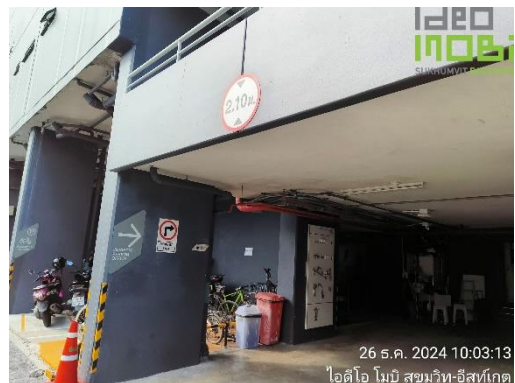
ภาพที่ 10 ป้ายสัญญาณจราจร (ต่อ)