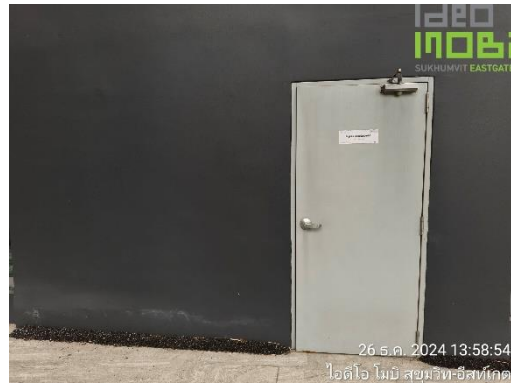
ภาพที่ 40 ประตูบันไดหนีไฟ ชั้น ST 2