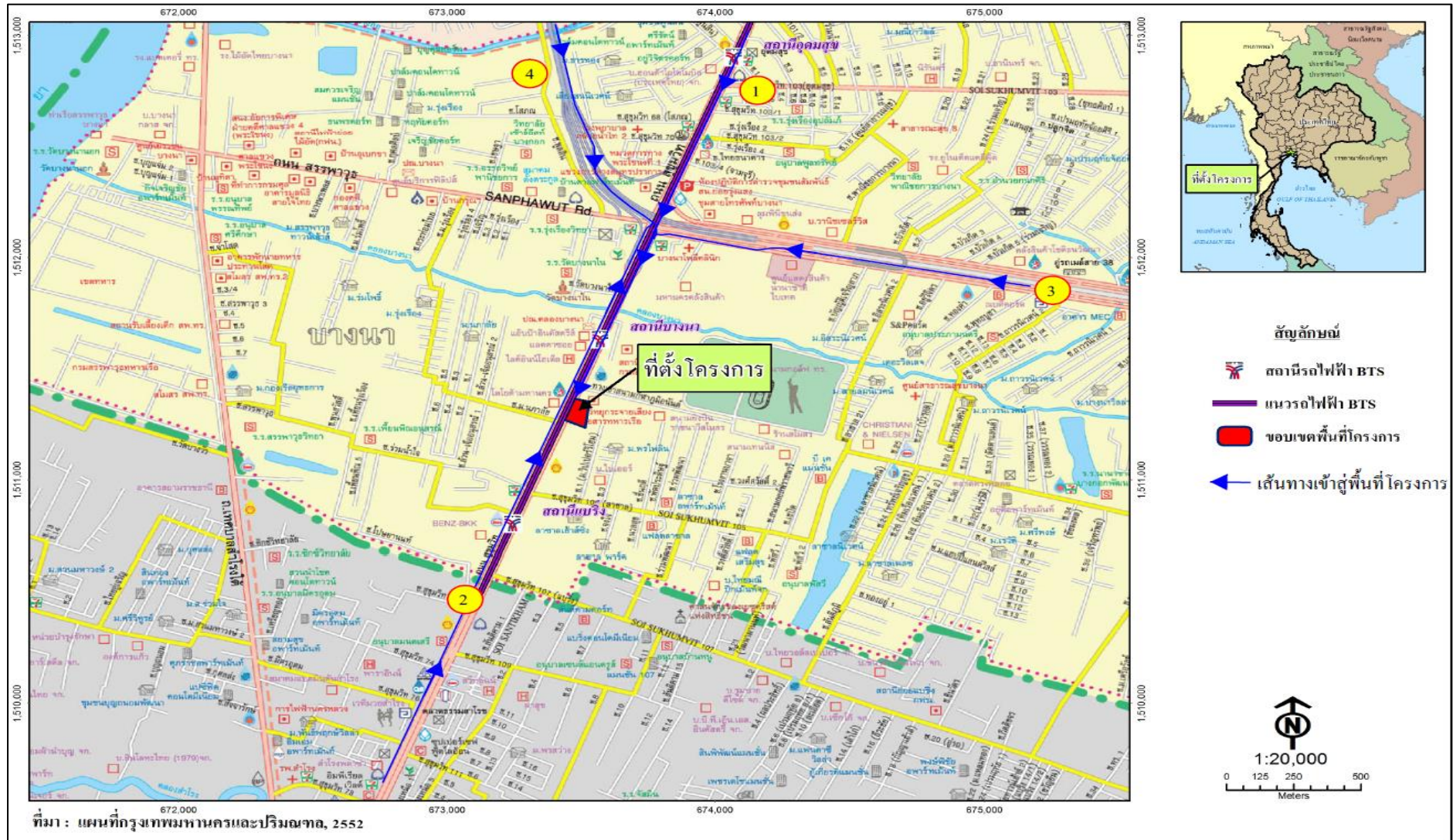
รูปที่ 2.1-4 เส้นทางเข้าสู่พื้นที่โครงการ