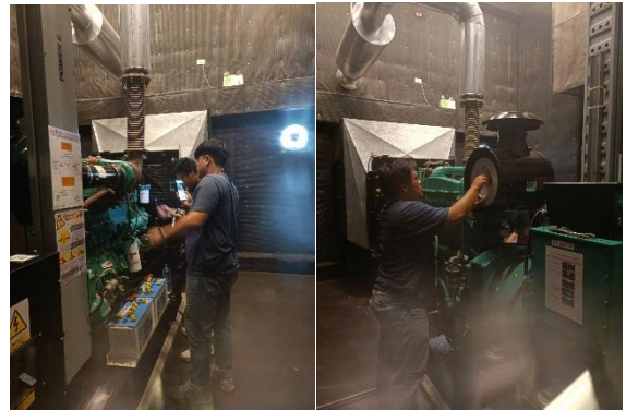
ภาพที่ 26 เครื่องกำเนิดไฟฟ้าสำรอง