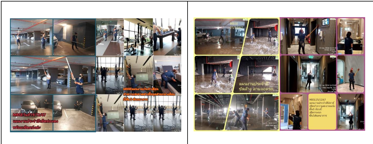
ภาพที่ 11 เจ้าหน้าที่รักษาความสะอาด