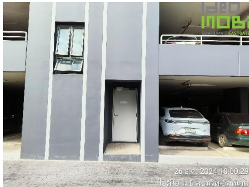
ภาพที่ 39 ประตูบันไดหนีไฟ ชั้น ST 1