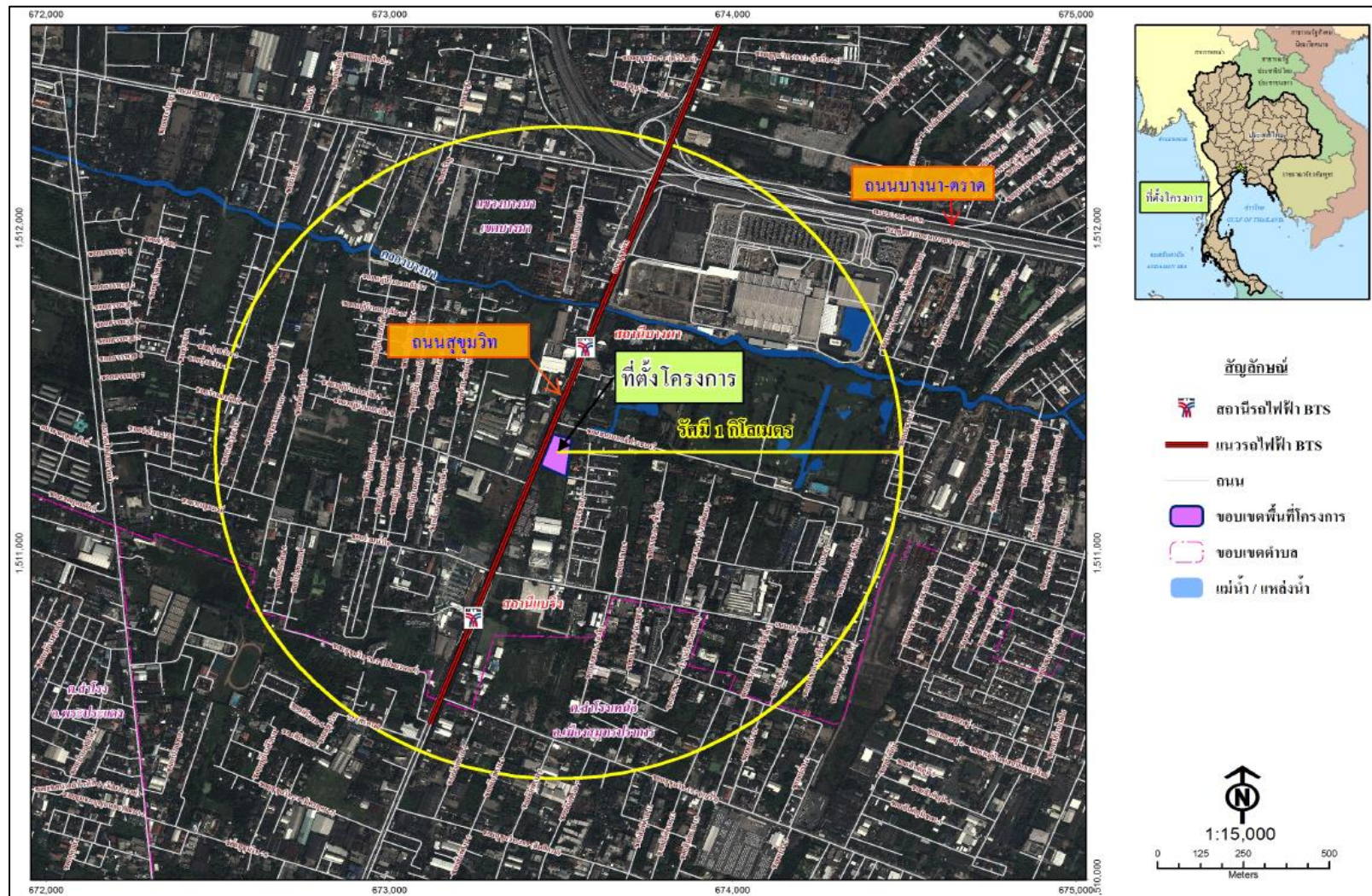
รูปที่ 2.1-1 ตำแหน่งที่ตั้งโครงการ