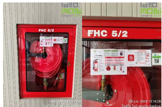
ภาพที่ 28 อุปกรณ์ดับเพลิง