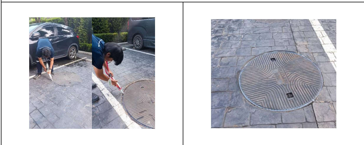
ภาพที่ 13 ระบบบำบัดน้ำเสีย ยิงชีลีโคนปิดฝาป้องกันกลิ่นย้อนกลับ